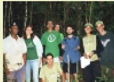
Expedição no ribeirão Macacos

Outra importante ação é o trabalho conjunto com diversas associações do entorno da serra. Recentemente, membros da Amaserra participaram ativamente do movimento de mais de 2.000 pessoas em defesa da serra da Moeda e do II Combio - Congresso Mineiro de Biodiversidade, apresentando-se em estande.